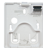
TASTA Montageschale zur Montage auf Wand und UP-Dose (im Lieferumfang enthalten)