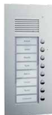
Serie PUK (s.o.) und Serie AVU (s.u.).